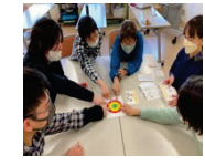
アンガーマネジメント