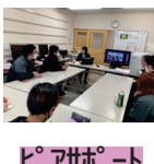
ピアサポート 交流会