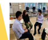
グループ ディスカッション